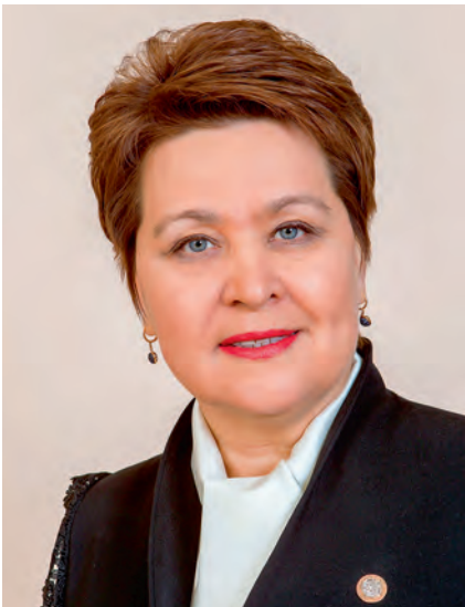
Сария Харисовна САБУРСКАЯ

Уполномоченный по правам человека в Республике Татарстан