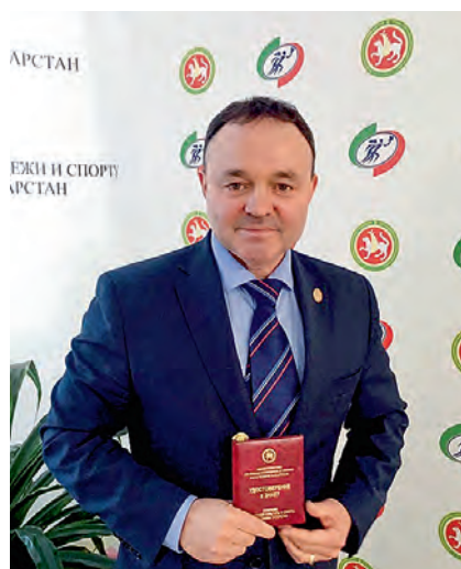
Фархат Гусманович ХУСНУТДИНОВ Председатель Конституционного суда Республики Татарстан