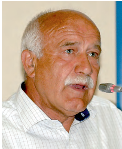
Чингис Усманович МАХМУТОВ Председатель Общественного совета при Министерстве здравоохранения Республики Татарстан